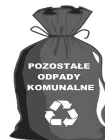
WORKI LUB POJEMNIK ZAPEWNIĄ WŁAŚCICIEL