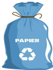
WORKI ZAPEWNIĄ ZM NATURA