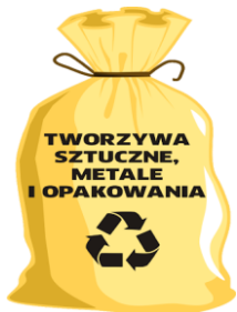
WORKI ZAPEWNIĄ ZM NATURA