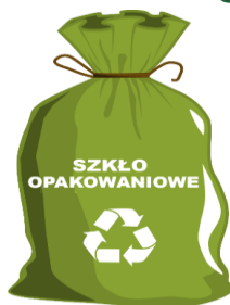
WORKI ZAPEWNIĄ ZM NATURA