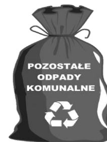
WORKI LUB POJEMNIK ZAPEWNIĄ WŁAŚCICIEL